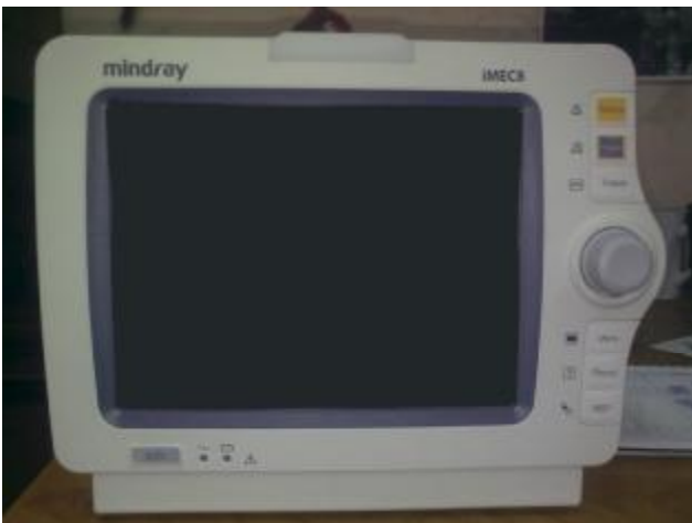
Рисунок 1. Внешний вид монитора пациента модели iMEC8.