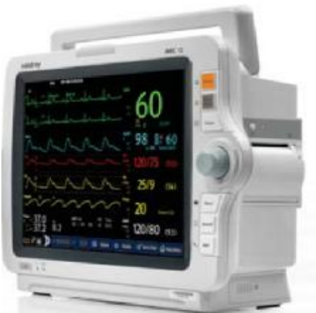
Рисунок 5. Внешний вид монитора пациента модели iMEC12.