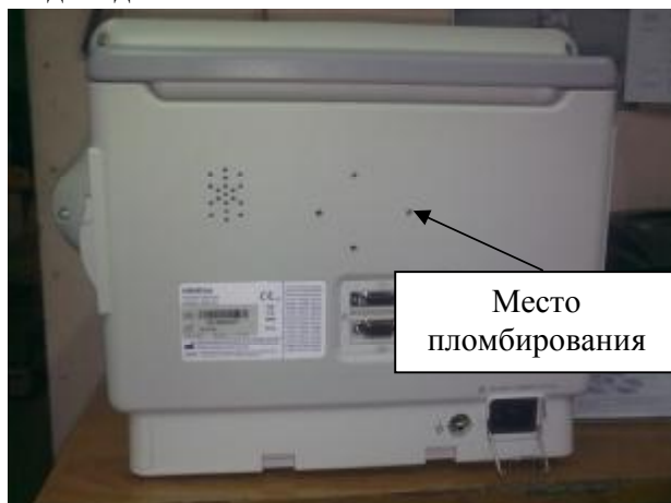
Рисунок 4. Монитор пациента модели iMEC10. Вид сзади.