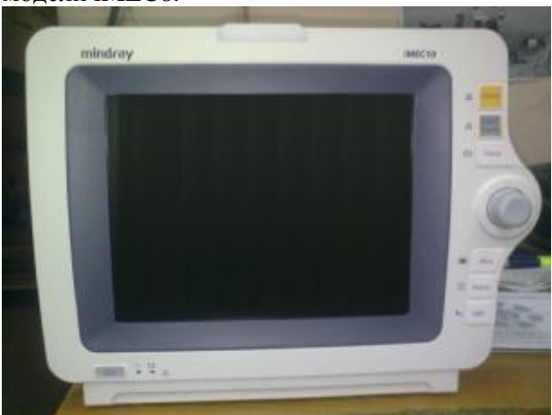
Рисунок 3. Внешний вид монитора пациента модели iMEC10.