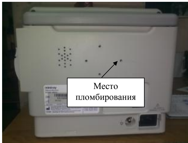
Рисунок 2. Монитор пациента модели iMEC8. Вид сзади.